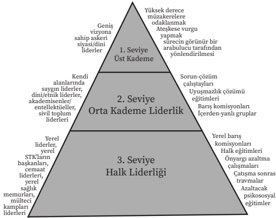
ŞEKİL 1 Barış Çalışmalarında Aktörler